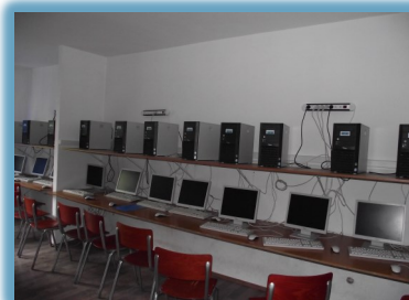
Laboratoare informatică performante