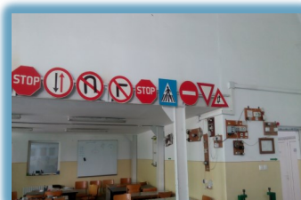
Spații pregătire legislație auto