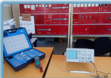
Laborator electrotehnică cu echipamente moderne