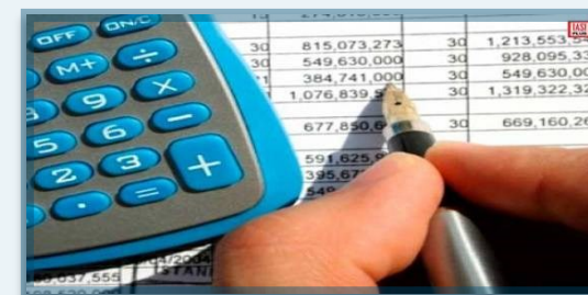
Tehnician în activități economice