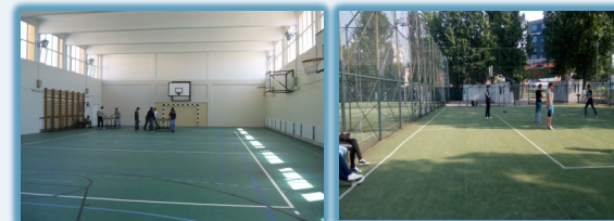
Sala de sport cu teren baschet, handbal și fotbal,

Orice elev poate obține la noi Permisul ECDL (European Computer Driver Licence ) și Permisul de Conducere Auto