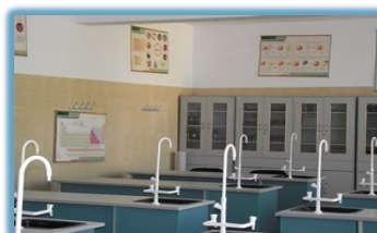
Laboratoare chimie dotate cu soft educațional și internet