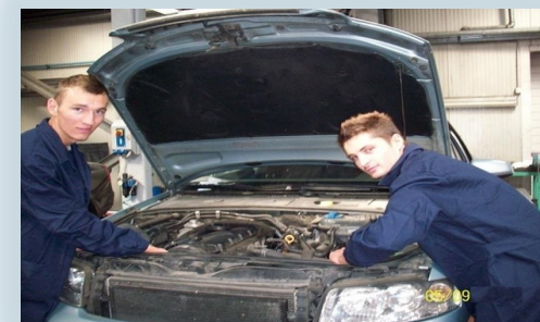
Practică la agenții economici