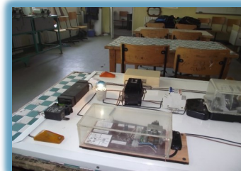
Spații pregătire practică