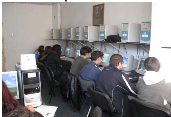
Laborator informatica – conexiune internet