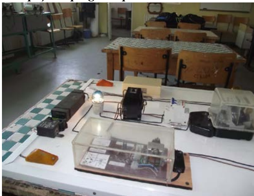
Spații de pregătire practică