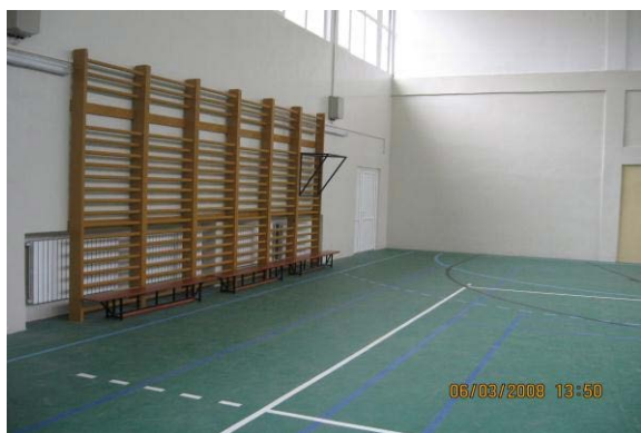
Sala de sport