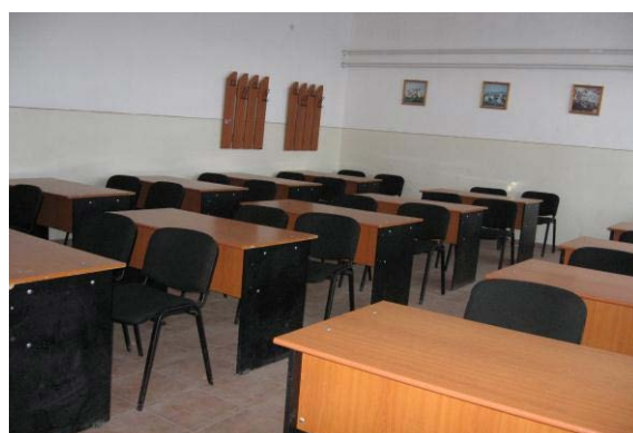
Sala de curs