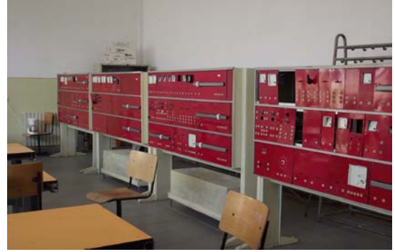
Laborator electrotehnică cu echipamente moderne