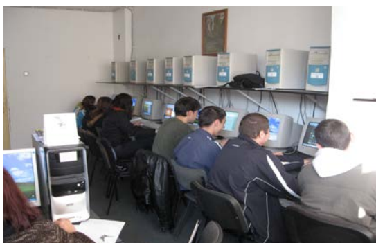
Laboratoare informatică cu conexiune internet, videoproiectoare, ecrane proiecție