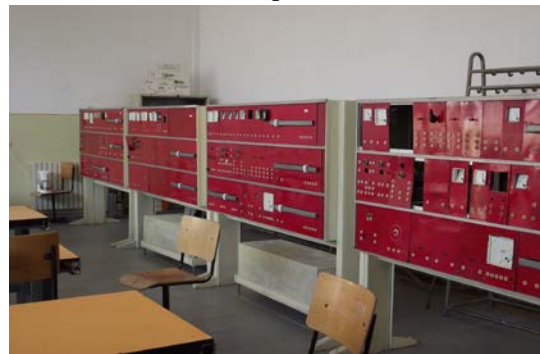
Laborator electrotehnică cu echipamente moderne